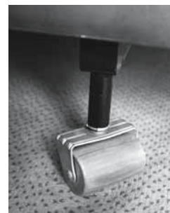
Bild 2: Fest montierte Räder am Bett ermöglichen ein rückschonendes Betten