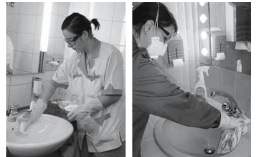
Bilder 6, 7: Korrektes Arbeiten mit säurehaltigem Entkalkungsmittel. Die Schutzmaske kommt bei ungenügender Lüftung zum Einsatz.