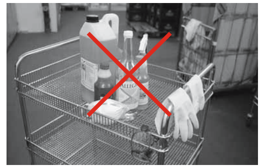
Bild 5: Um Verwechslungen und Vergiftungen zu vermeiden, sollen nur Originalgebinde verwendet werden.