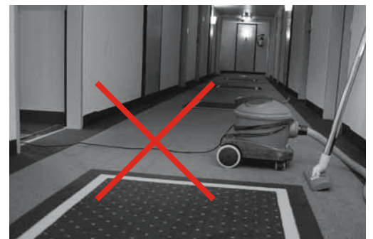
Bild 8: Quer durch Korridore führende Stromkabel bilden gefährliche Stolperstellen.