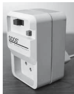
Bild 1: Im Fachhandel sind spezielle FI-Aufsatzstecker erhältlich.

Achtung: Keramische Böden und Steinböden können durch Fachfirmen nachträglich rutschfest gemacht werden.