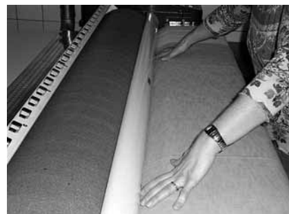
Bild 3: Mangle mit Finger- und Handschutz. Bei Berühren der Schutzeinrichtung wird die Maschine sofort abgestellt.