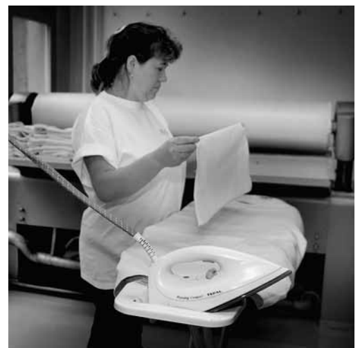
Bild 11: Für Bügeleisen, die gerade nicht gebraucht werden, ist immer ein sicherer Standort zu wählen. Im hektischen Gewerbebetrieb genügt die Auflage des Bügelbrettes nicht.

Es ist möglich, dass in Ihrem Betrieb noch weitere Gefahren zum Thema dieser Checkliste bestehen. Ist dies der Fall, treffen Sie die notwendigen Massnahmen (siehe Rückseite).