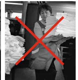
Bilder 9 und 10: Durch gute Sicht lassen sich Stolper- und Ausrutschunfälle sowie Zusammenstösse vermeiden.