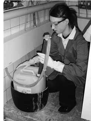
Bild 8: Beim Umgang mit Reinigungskonzentraten werden Schutzbrille und Schutzhandschuhe getragen.