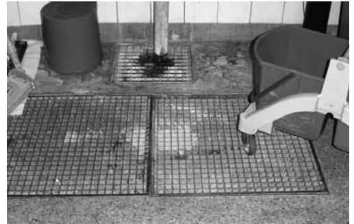
Bild 1: Bodenebene, rutschhemmende Bodengitter schützen vor Ausrutschunfällen.

Achtung: Keramische Böden und Steinböden können durch Fachfirmen nachträglich rutschfest gemacht werden.